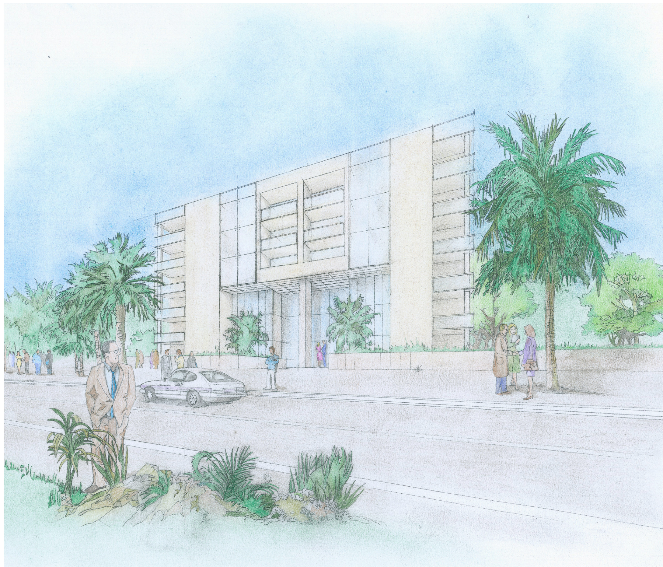
Schizzo interpretativo del tipo edilizio esclusivamente residenziale, con giardini privati, nell'estremo meridionale dell'area