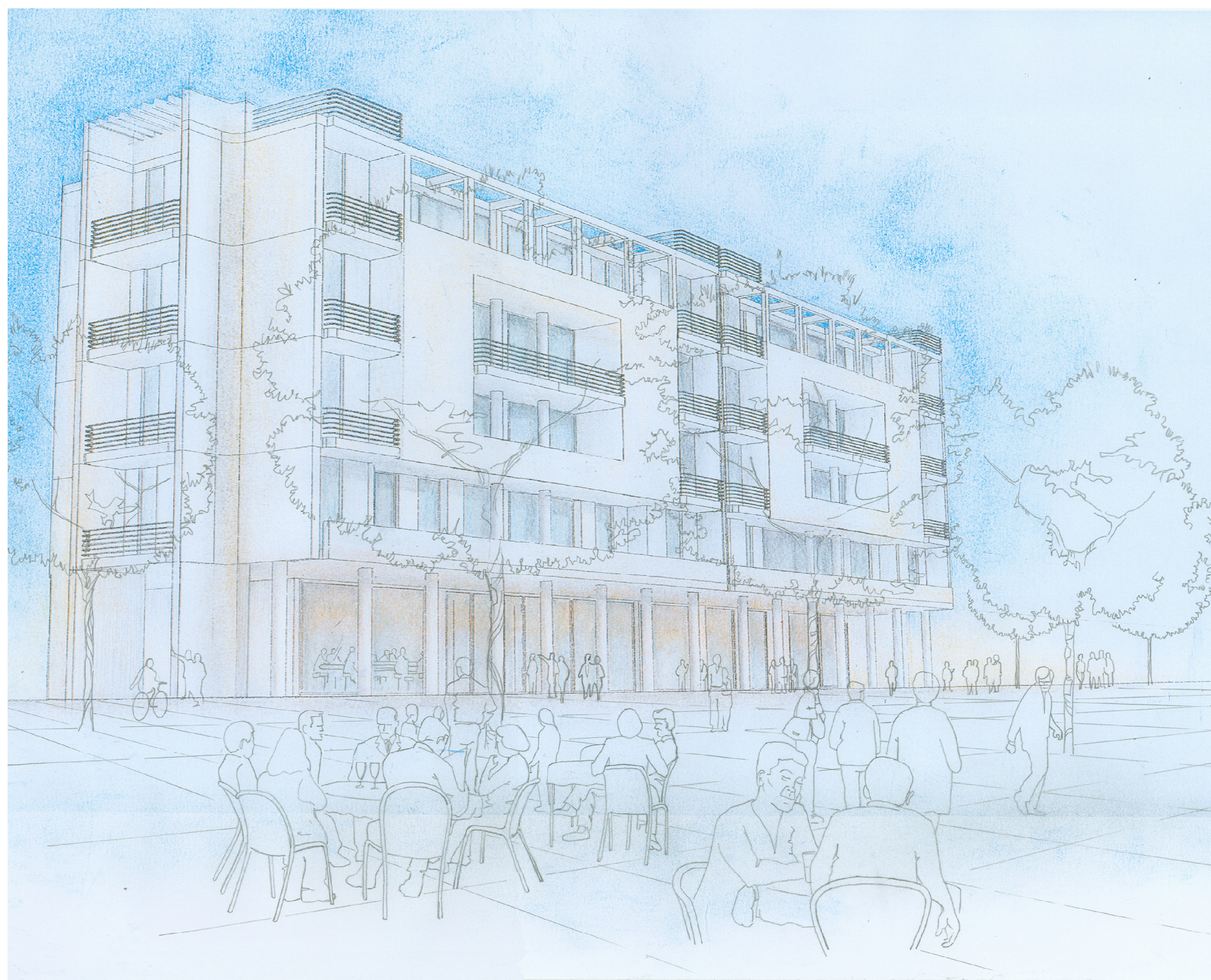
Schizzi interpretativi di uno dei tipi edilizi prospettanti sulla passeggiata pubblica