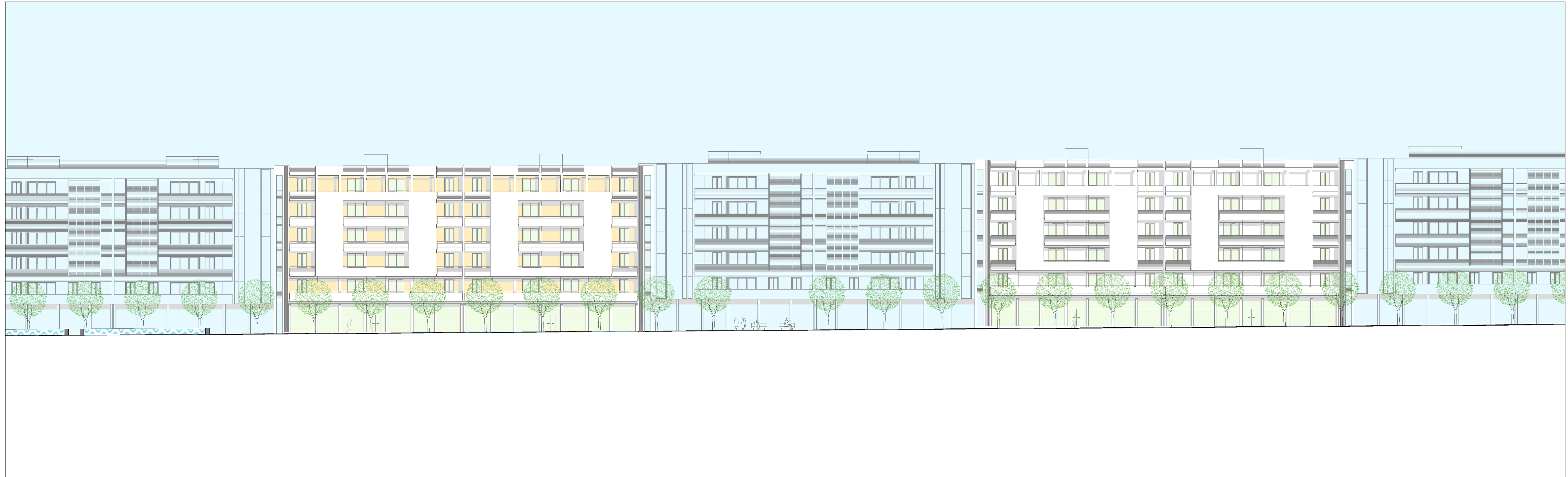
Studio interpretativo della cortina edilizia sulla passeggiata pubblica