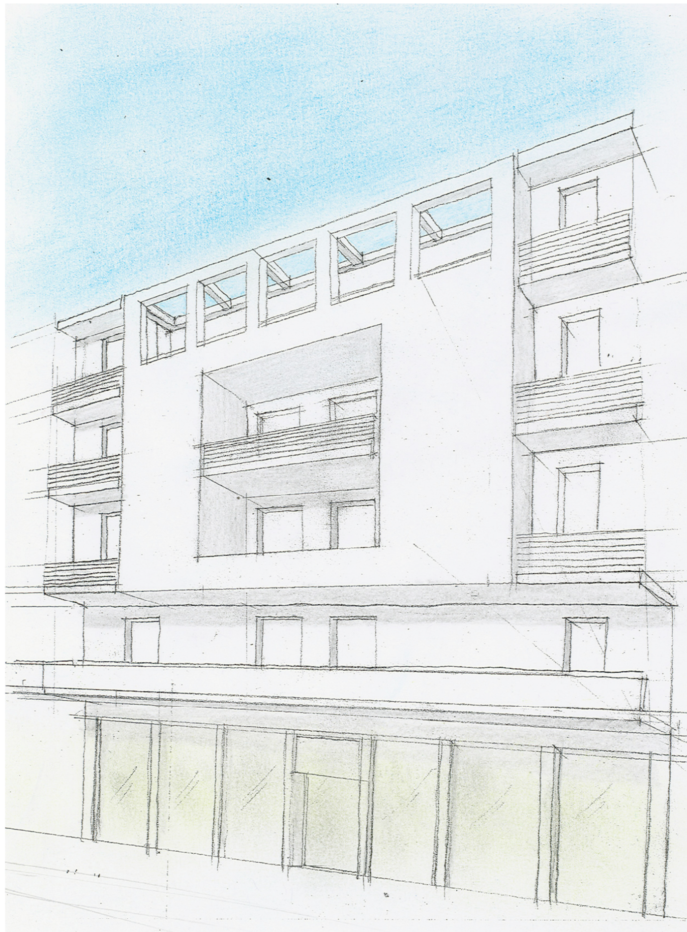
Studio degli elementi compositivi di facciata